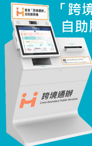
「跨境通辦」 自助服務機