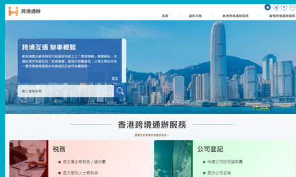
「跨境通辦」專題網站