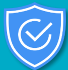
「廣東省統一身份認證平台」