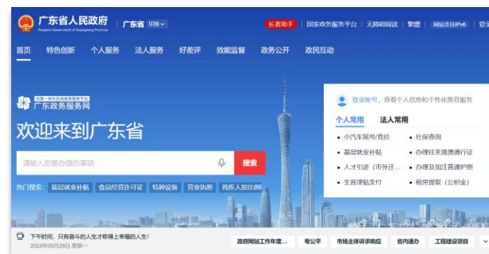
廣東省政務服務網