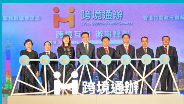
「跨境通辦」合作成果發布會 2023年11月