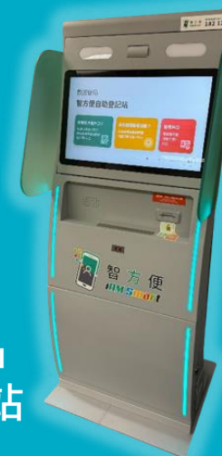
「智方便」 自助登記站