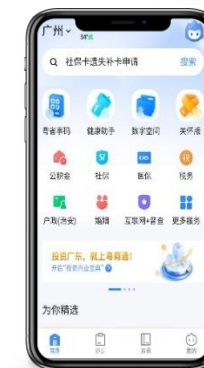
「粵省事」 手機應用程式